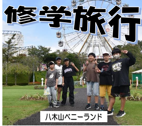
八木山ベニーランド