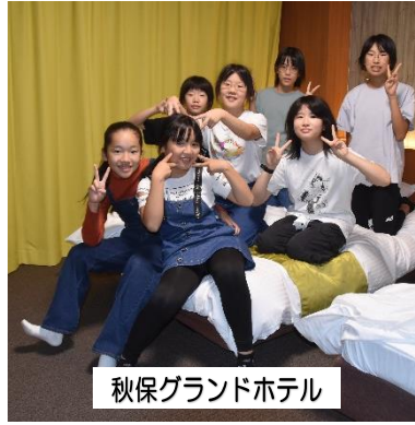
秋保グランドホテル