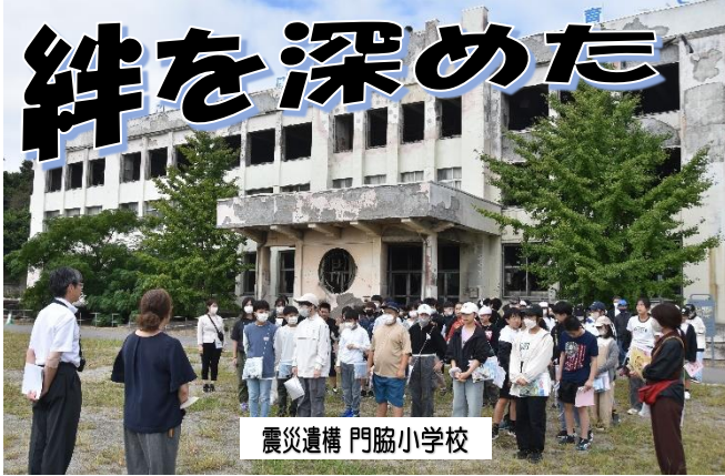
震災遺構 門脇小学校